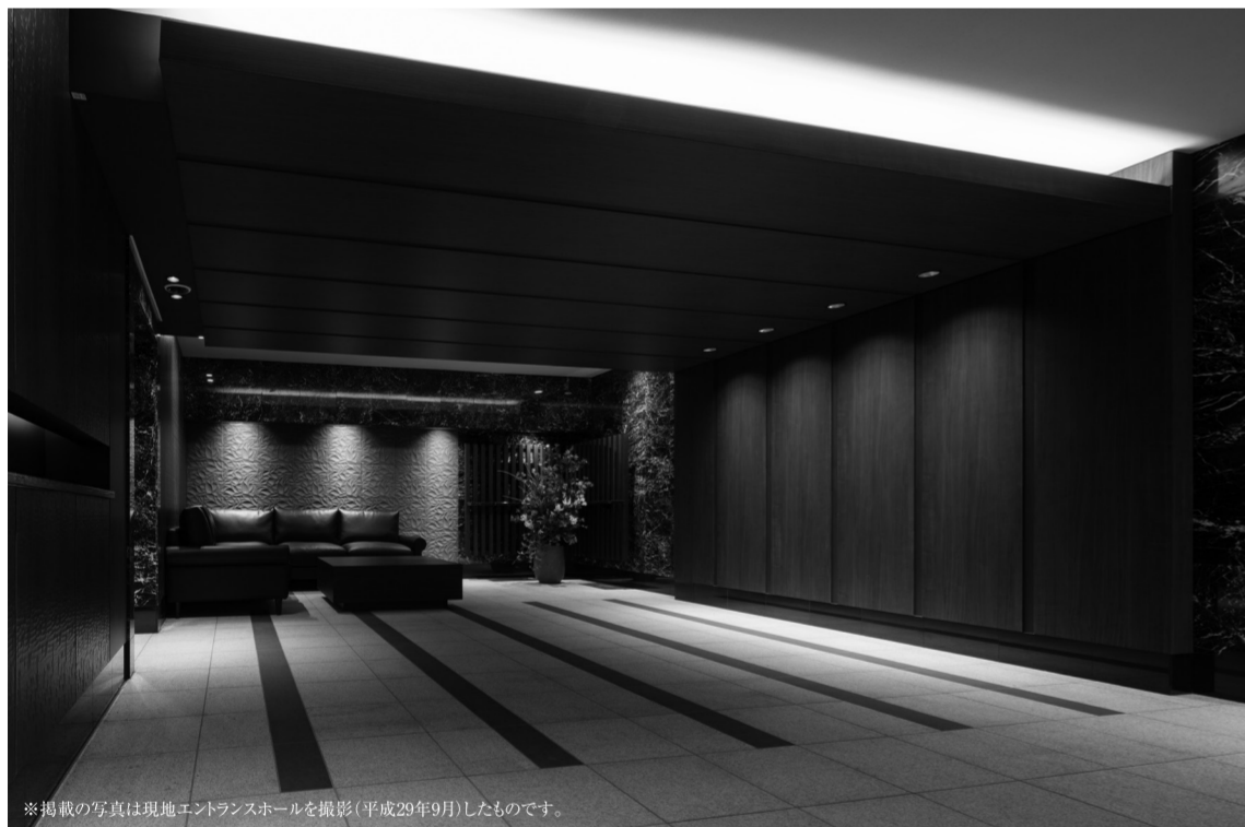
※掲載の写真は現地エントランスホールを撮影(平成29年9月)したものです。