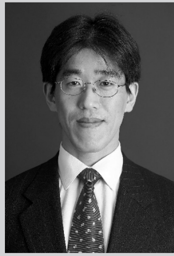
慶應義塾大学大学院 メディアデザイン研究科教授 岸博幸氏

クreasライフ マンション経営セミナー2017 辛口かつユニークな解説でテレビでもおなじみの岸博幸氏をゲストに迎え、今後の経済動向予測を伺います。この機会にふるってご参加ください。